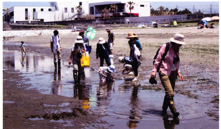
⑤検見川浜自然観察会