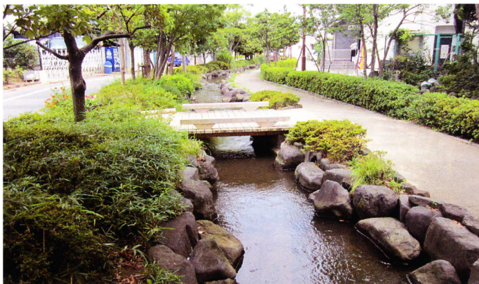
④一之江境川親水公園